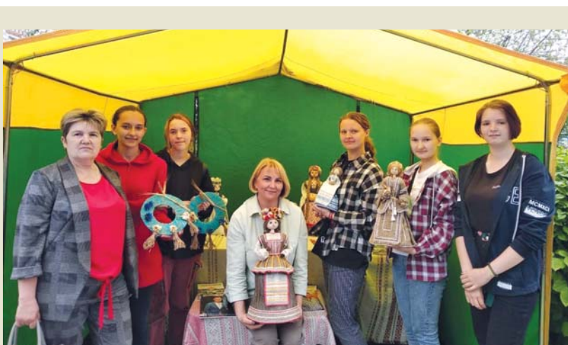
У белорусских мастериц замечательные куклы