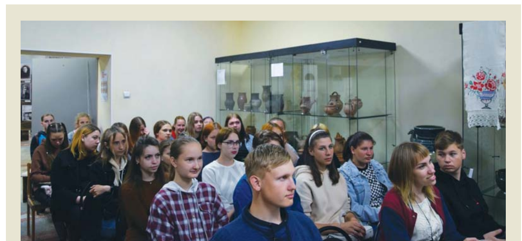
Встречи в музейных залах – это незабываемые уроки об истории края