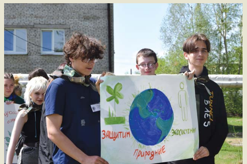
Плакат – действенный агитационный материал