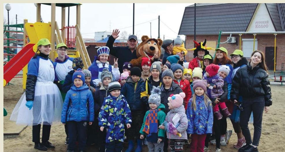
Малышам радостно, когда рядом с ними старшие друзья

Ребята из студсовета и Little-совета техникума желанные гости на городских детских площадках. Очередной раз они побывали у малышей и провели игры на экологическую тему и показали театрализованное представление «В начале было Слово», ко-