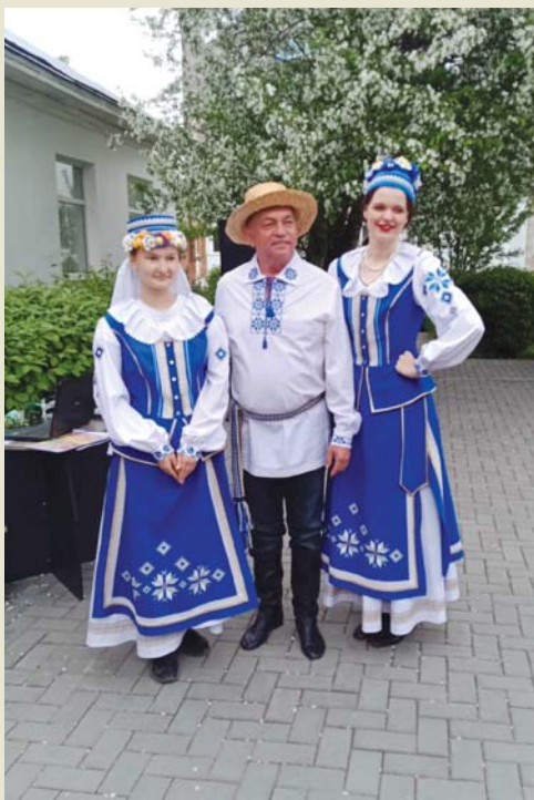
Национальный белорусский наряд всем к лицу