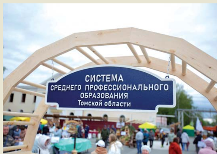
Вход на территорию СПО