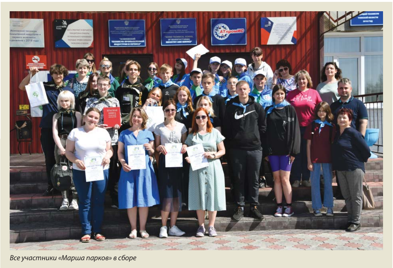
Все участники «Марша парков» в сборе