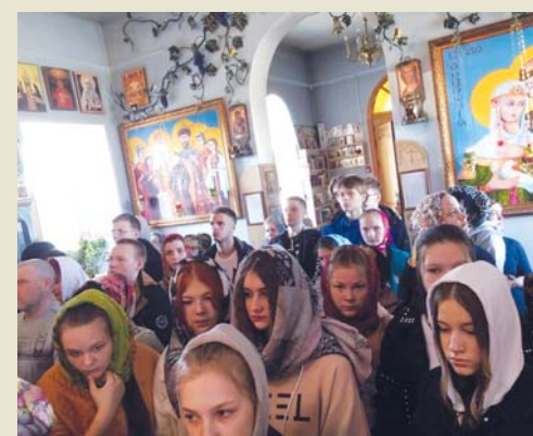
Для многих студентов это первая служба в Храме