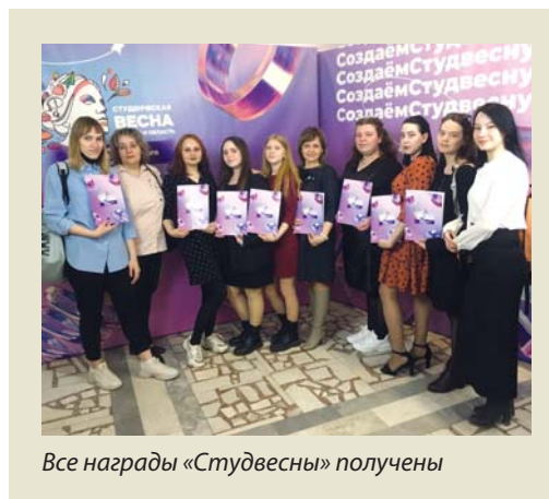
Все награды «Студвесны» получены

В Томской области популярен Всероссийский фестиваль «Студенческая весна» – уникальный проект в сфере творчества студенческой молодёжи России. Ежегодно томские ребята готовят творческие программы и индивидуальные номера в разных направлениях. Это требует большой самоотдачи, дисциплины, умения работать в команде и, конечно таланта. Творческая программа Асиновского техникума промышленной индустрии и сервиса называлась «В начале было Слово». Её делегация АТпромИС показала на грандиозном мероприятии в системе среднего профессионального образования – Гала-концерте по итогам регионального этапа Российской «Студвесны».