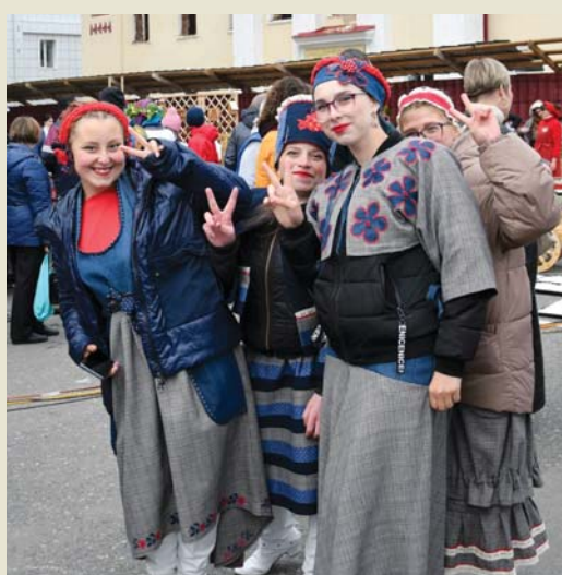
Наряды по сезону к лицу студенткам АТпромИС