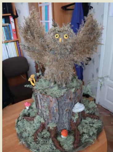
Подделка, Анжелика ЛОБАНОВА