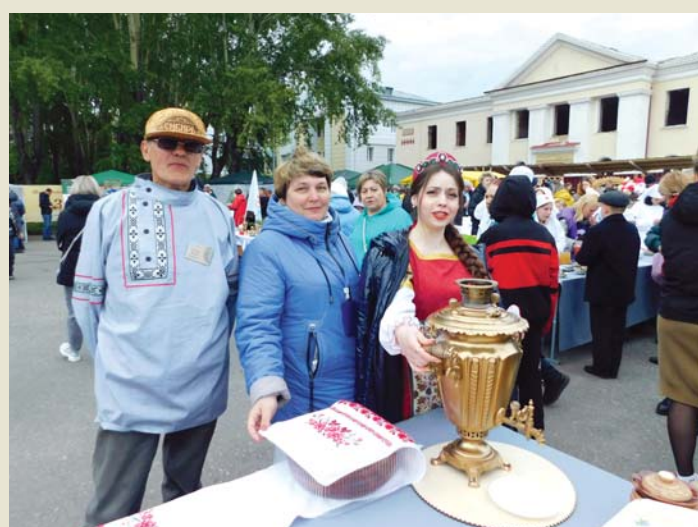
Гостеприимство – добрая традиция коллектива техникума