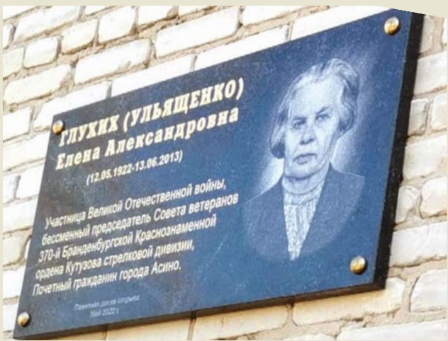
Мемориальная доска закреплена на стене второго корпуса техникума