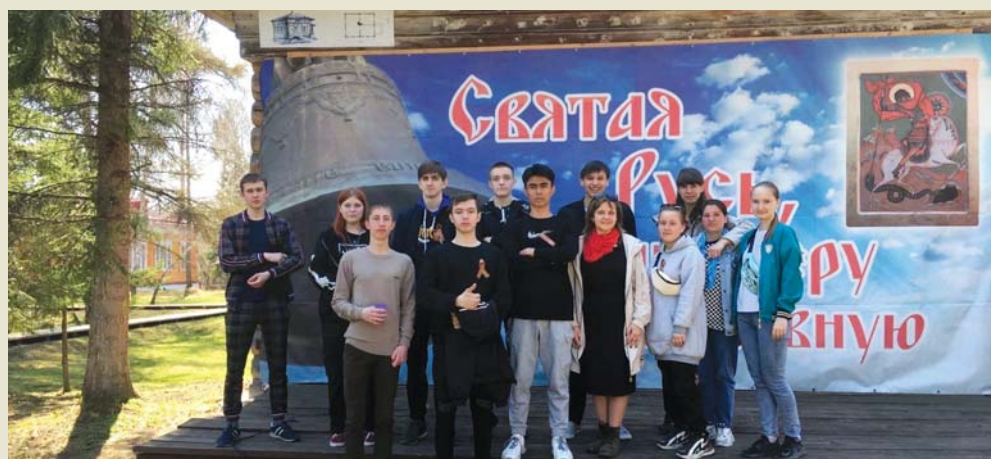
Участвовали в Престольном празднике