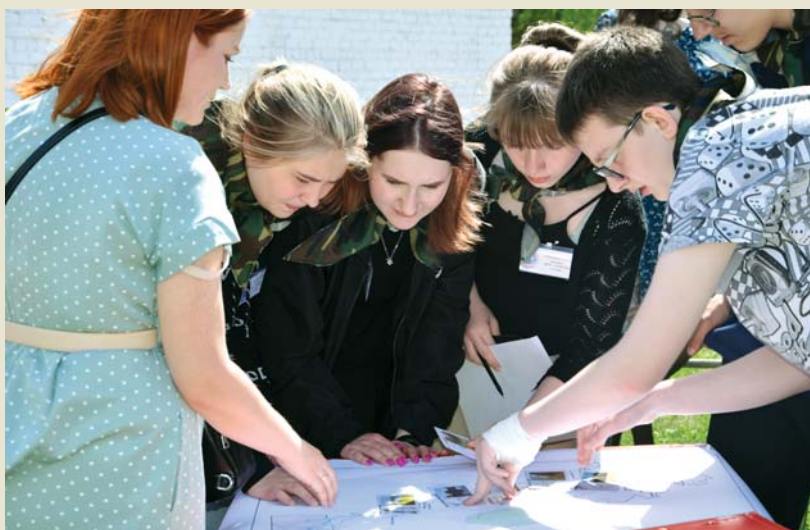
Команда «Экологический спецназ» из школы №4 заняла 2 место