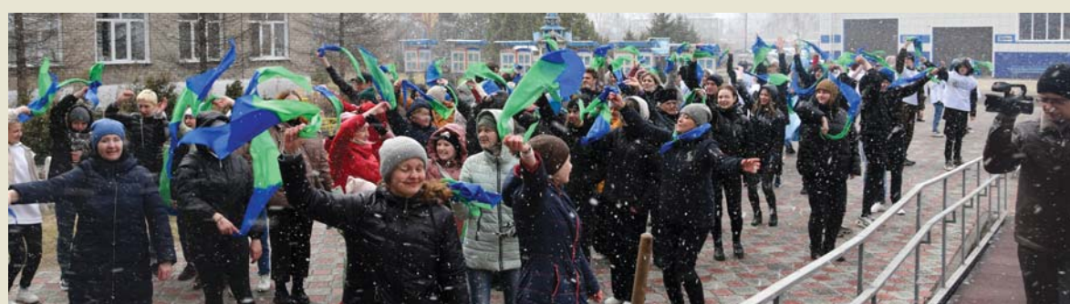
И снег, и ветер не испугали участников заключительного флешмоба на фестивале