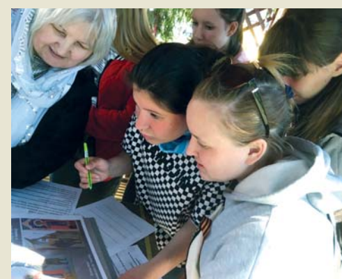
Отвечали, в чём подвиг Георгия Победоносца