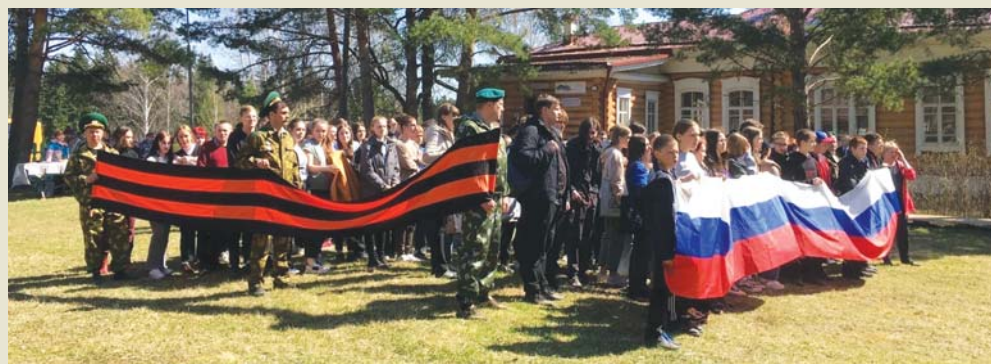
Святость и патриотизм – едины

Постоянными посетителями усадьбы давно стали студенты АТпромИС. Всякий раз им предлагают увлекательные познавательные и развлекательные программы.