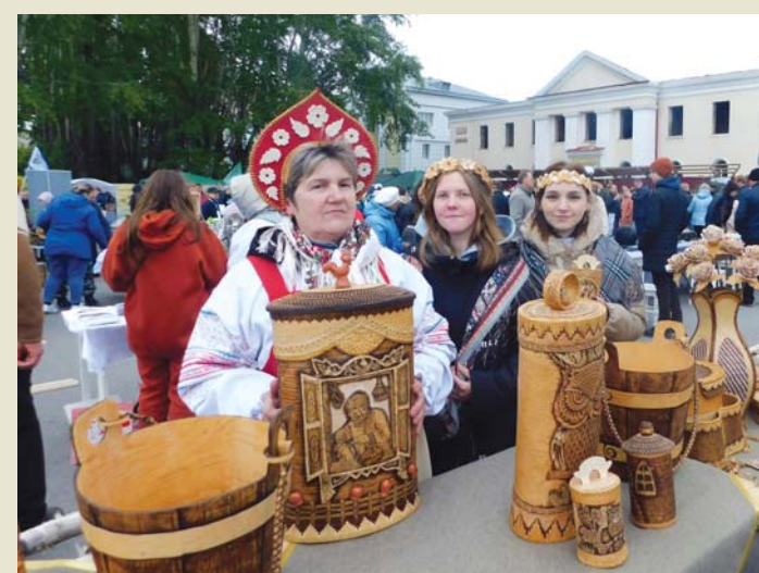
Выставочный ряд мастера С.М. Масанкиной