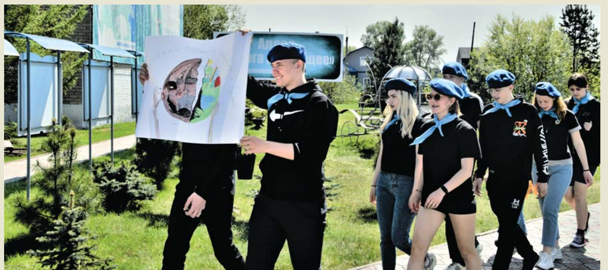
Победный марш «Экодесанта» из школы №1