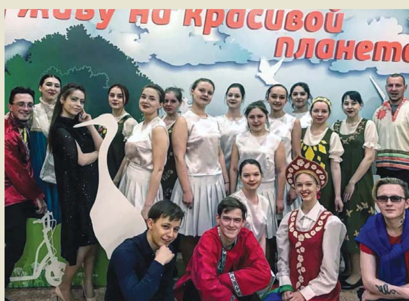
На фестивале «Я живу на красивой планете»