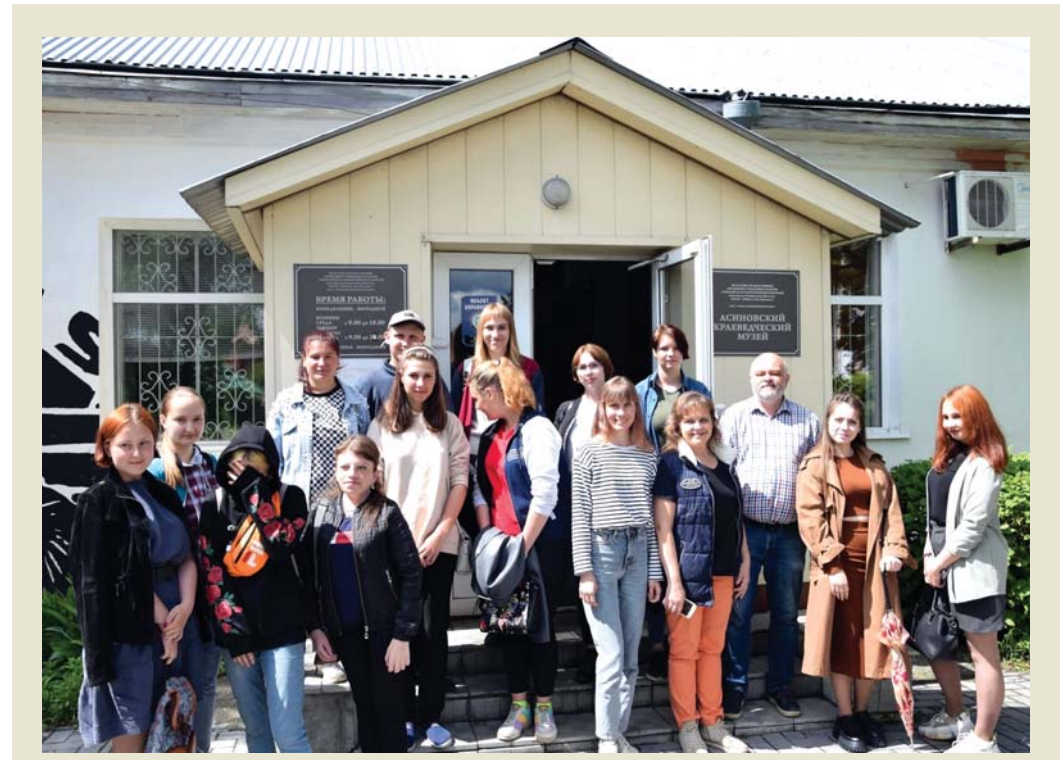
В АРТ-РЕЗИДЕНЦИИ студенты получили советы опытных журналистов

На следующий день визита в Центре культурного развития г. Асино состоялась