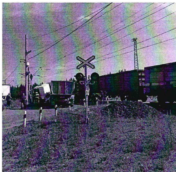
Последствия после столкновения пассажирского поезда, с грузовым автомобилем «КАМАЗ» в Волгоградской области на перегоне Гремячая – Котельниково.